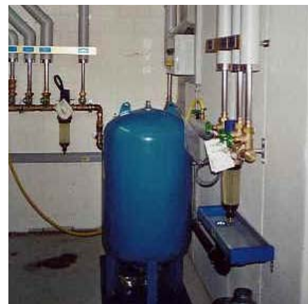
Druckerrhöhungsanlage im Technikraum