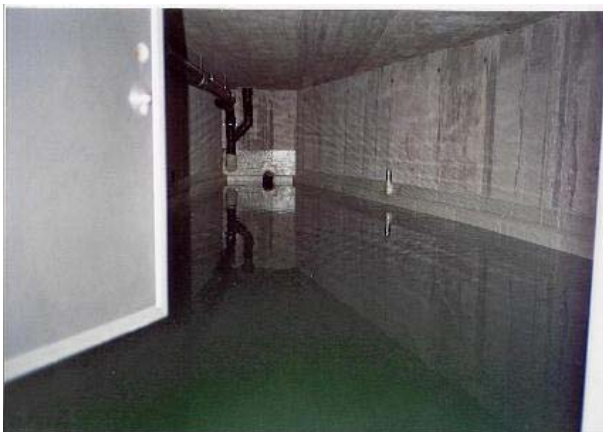
Regenwassertank im Keller, 12 m3 Inhalt

Der Trinkwasserverbrauch wird wesentlich reduziert, indem im Mehrfamilienhaus Rötiboden das Regenwasser in einem Tankraum gesammelt wird und für die WC-Spülungen und die Waschmaschinen verwendet werden kann. Das Regenwasser der gesamten Dachfläche (550 m 2 ) wird gefasst und in einen Tankraum mit einer Kapazität von 12'000 Liter geleitet. Eine gesteuerte Trinkwasserzufuhr in diesen Tank gewährleistet, dass jederzeit Brauchwasser vorhanden ist. Die Verwendung von Regenwasser zur WC-Spülung und zum Wäsche waschen ist hygienisch absolut unbedenklich! Das weiche Regenwasser verzögert sogar das Verkalken der Heizstäbe in den Waschmaschinen und verlängert auf diese Weise deren Lebensdauer. Im weiteren bewirkt das weiche Regenwasser auch eine Reduktion der Waschmitteldosierung.