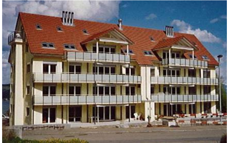
Visualisierung: Daniel Kurz, Architekturbüro, Zürich Foto: Huber Energietechnik, Zürich (April 2001)